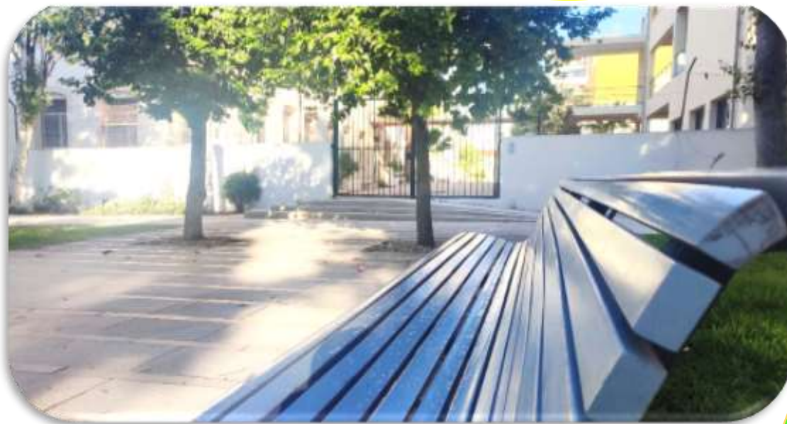
Espaço exterior da Escola Secundária Tomás Cabreira – vista do portão de acesso, no Jardim da Alameda. ★

Título: Afinal, a nossa ESCOLA tem um JARDIM à PORTA!