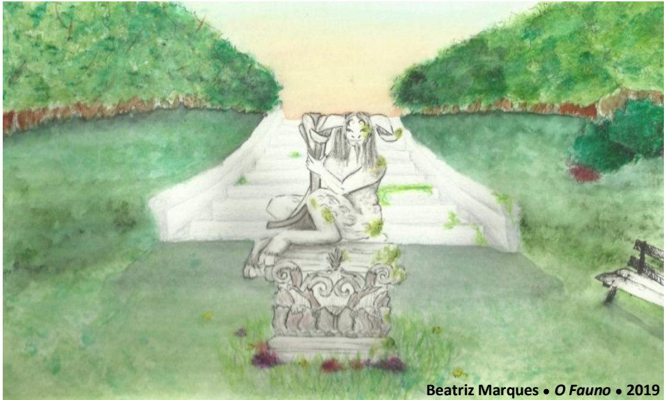
Beatriz Marques • O Fauno • 2019

No parque, ao fim de uma alameda sombreada por viridentes 1 carvalheiras, sobre um rendilhado 2 plinto 3 guarnecido de festões 4 graciosos,